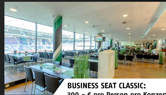
BUSINESS SEAT CLASSIC: 300,- € pro Person pro Konzert