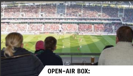
OPEN-AIR BOX: 225,- € pro Person pro Konzert