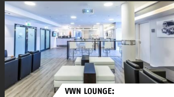
VVN LOUNGE: 300,- € pro Person pro Konzert